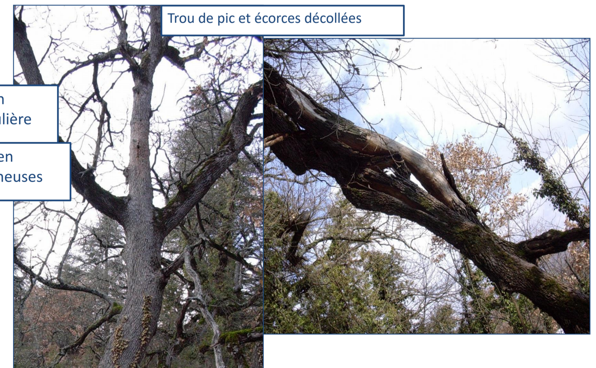
Trou de pic et écorces décollées