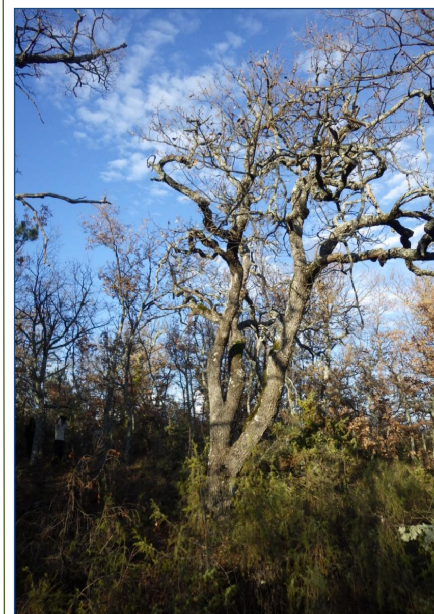
La gestion en Futaie irrégulière La diversité en Essences ligneuses