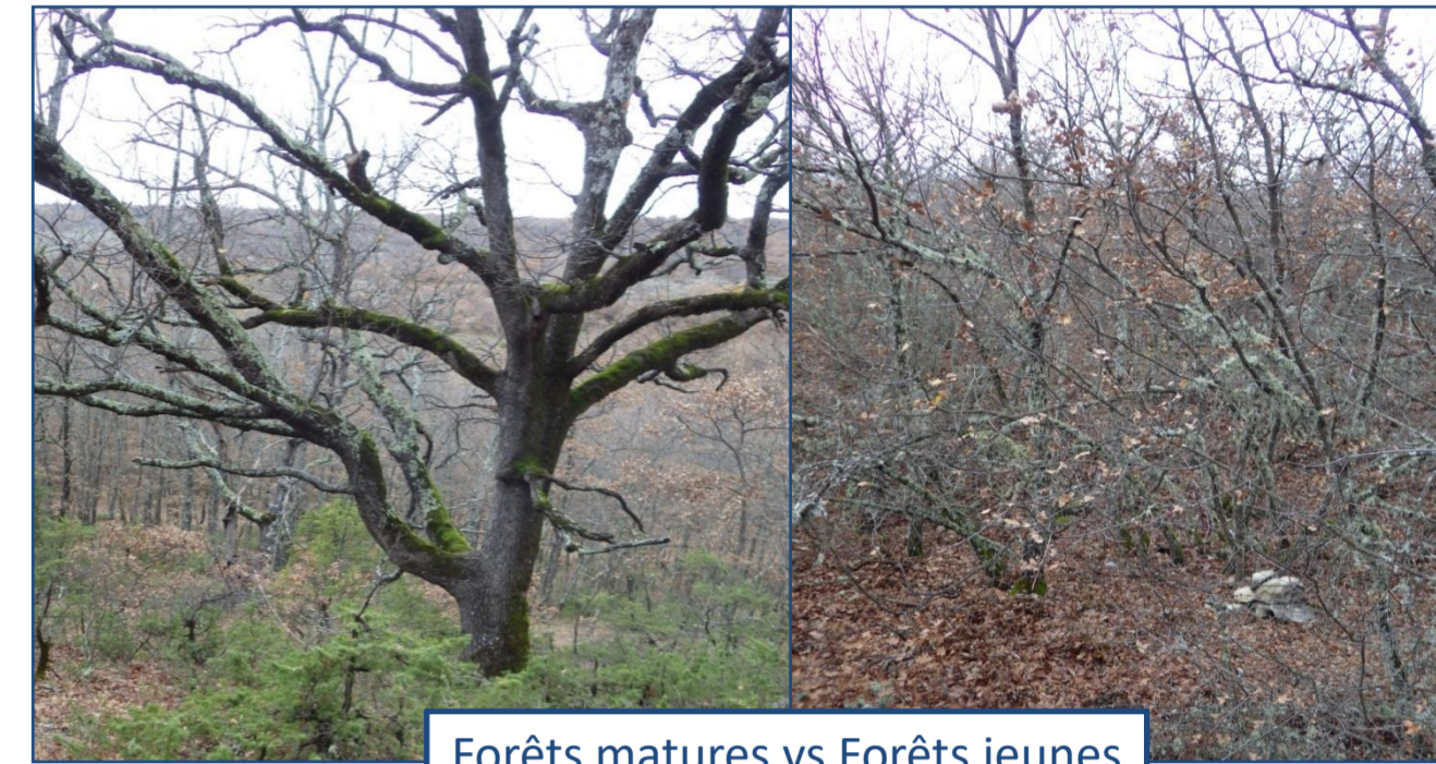
Forêts matures vs Forêts jeunes