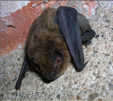
Pipistrellus pipistrellus Yan DAUPHIN