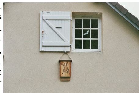
Gîte en bois placé sur la façade

Depuis un peu plus de deux ans maintenant, l'opération « Refuge pour les chauves-souris » fait sa place dans les propriétés publiques et privées. Fruit du partenariat de la SFPEM et structures relais locales et de la volonté des propriétaires d'œuvrer pour la protection des chauves-souris, elle a permis de constituer un réseau de 213 refuges à travers la France dont près d'une centaine en Bretagne. A ce jour, les deux tiers des conventions ont été signés par des particuliers et environ un tiers par des communes. Ces chiffres, très encourageants, prouvent l'intérêt grandissant du grand public pour ces mammifères fragiles et discrets. A terme, les différents refuges ainsi créés pourraient constituer un maillage dense de gîtes et de jardins favorables aux chauves-souris, et contribuer à l'amélioration de l'état des populations.