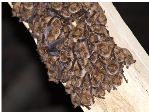
Colonie de Murins à oreilles échanquées

Le Conservatoire d'Espaces Naturels de Picardie et Picardie Nature se sont associés pour la réalisation d'une étude de la fonctionnalité du territoire d'Amiens métropole pour l'accueil des Chiroptères. La première phase a consisté en une analyse théorique de nombreuses données SIG (occupation du sol, linéaire arboré, réseau hydrique...) sur les 33 communes de la métropole. Cette analyse a permis la définition de secteurs à fort enjeu sur lesquels ont été réalisées, en priorité, les prospections de la phase suivante. La seconde phase a fait l'objet d'un stage conventionné et consistait en une recherche de colonies en milieu bâti,