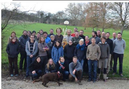
Stage capture Grand Est – décembre 2013