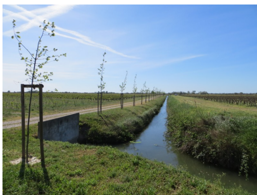
Plantation de haies sur le Domaine de Listel (Camargue gardoise)

Le séminaire de restitution du LIFE+ ChiroMed s'est déroulé à Arles le 8 avril 2014 et a été suivi d'une journée terrain, le 9 avril 2014, permettant notamment aux partenaires de visiter les différents sites aménagés en Camargue, aux Marais du Vigueirat ainsi qu'en Camargue gardoise.