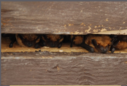
Sérotine commune