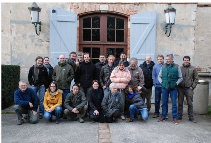
Stage Midi Pyrénées

En 2014, de nouveaux stages théoriques ont eu lieu : en Midi-Pyrénées (co-organisé par le GCMP/CEN MP), dans le Limousin en compagnie des Auvergnats (Chauves-souris Auvergne – GMHL), en Pays-de-la-Loire en compagnie des Bretons (BV/GMB/GCPDL) et en Rhône-Alpes (GCRA-LPO RA- FRAP-NA). Et d'autres sont à venir en 2014 et 2015, notamment en région Centre, en Aquitaine, en Languedoc-Roussillon et en Ile-de-France ! Un grand merci à toutes les personnes qui ont contribué au bon déroulement de ces stages ! Pour tous renseignements concernant les prochains stages dans vos régions, vous pouvez contacter les formateurs ou le MNHN