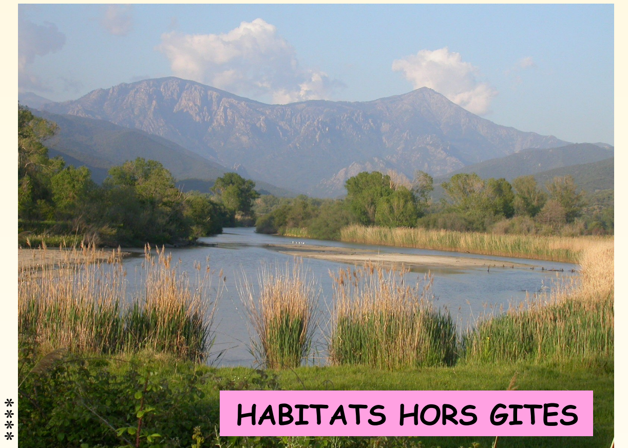
HABITATS HORS GITES